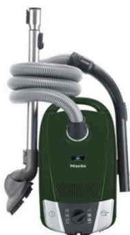
Miele Compact C2 EcoLine Plus