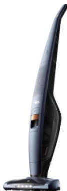
Electrolux UltraPower EUP86SSM