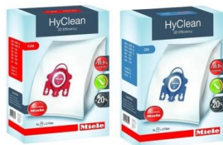
Ersatz Staubbeutel Miele FJM / GN pro Pack