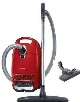
Miele Complete C3 C&D Hardfloor Powerline