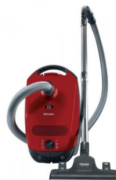
Miele Classic C1 Powerline