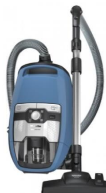
Miele Blizzard CX1 Racer beutellos